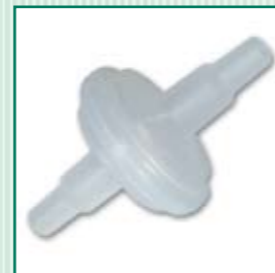
Filtro de succión MSF (empaque 20 uds)