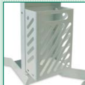
Cesta de apartamiento