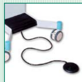
Switch de pedal