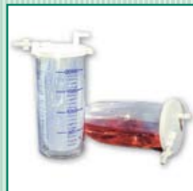
Bolsa desechable para la secreción MONOKIT

*) es necesario indicar en el pedido. Únicamente el productor puede ocuparse de la instalación adicional.