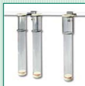
Almacén de algalias y soporte del almacén, simple, doble