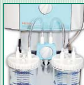
Switch de llenado de botellas