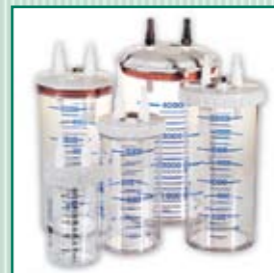
Recipientes colectores (botellas) 0,5 l, 1 l, 2 l y 4 l policarbonato, para multiuso, polisulfona