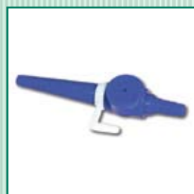
Stop válvula desechable